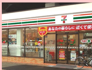
●セブン・イレブン 徒歩2分