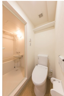
ウォシュレット付きトイレ