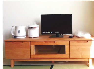
テレビ台・テレビ・炊飯ジャー・電気ケトル