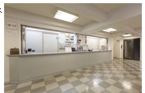
▲アビバードール御影東Ⅱのフロント