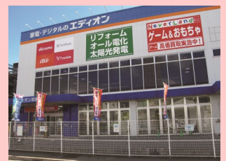
●エディオン 徒歩5分

山栄地所株式会社 [TEL]078-856-6301 [FAX]078-856-6305