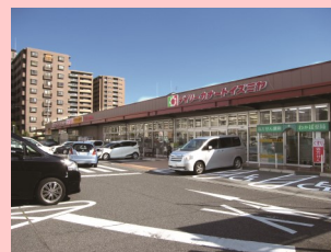
●デリーカーナート 徒歩5分