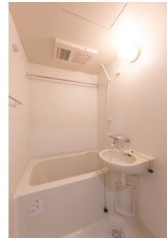
浴室暖房乾燥機付き

【個室設備】 収納付きシングルベッド・クローゼット・ウォシュレット付きトイレ・キッチン・浴室 (暖房乾燥機付き)